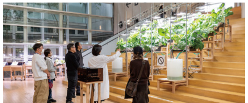
PROJECT MRT—Natureless Solution/太陽と土と糞から切り離れたテクノロジーの再考

いつでも誰でも新しい表現や情報に触れることができる場の提供に重点的に取組み「新たな価値と交流を生む文化芸術創造拠点」として発展させる。メディア・テクノロジーが持つ可能性とYCAMが有する創造性を様々な分野において発揮し、地域の多様な主体とともに創動的な活動を通じて、本市を進めるまちづくり「文化の薫る創造都市づくり」に貢献する。