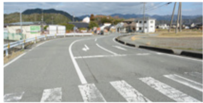
市道宮島町問田線

小京都に抜ける「市道問田5号線」から中村橋の交差点までは480mある。令和8年度は50mの工事、200mの測量設計で合計2,500万円の予算を計上している。