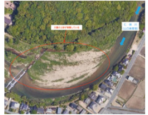
河川における土砂の堆積

土砂の堆積状況については確認しており、大内での移動市長室においても、浚渫の要望があったので、管理者の県に対し、見解を伺ったところ、現地の状況は把握していて、「特に、河川の曲がりの内側は土砂が堆積し易いことと、この箇所は、川幅が広がっているため、現在、大量の土砂が堆積しているが、通水部の流れは保たれており、経過観察をしている」とのことであった。市としては、仁保川に限らず、市内の県管理河川については、継続的に浚渫の要望をしている。