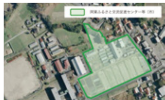
阿東ふるさと交流センター跡地

企業の方々と、現在、中山間地域で農業を守っておられる方々との新たな交流が始まり、賑わいが生まれ、地域住民と近隣都市住民との都市農村交流による中山間地域の活性化につながると考えてい