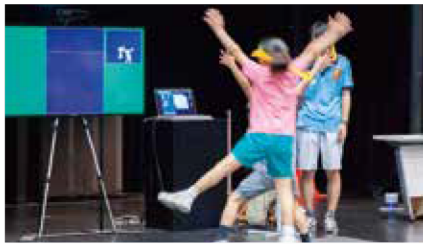
スポーツハッカソン

YCAMではこれまでに未来の山口の教育プログラム等を考案しており、その優位性をGIGAスクール構想でどのようにいかしていくのか伺う。