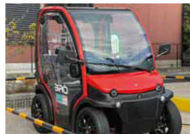
超小型モビリティ